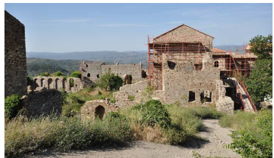
Mystras, venezianischer Palast

Am nächsten Tag, der erste Teil der Seereise, wurde bei schönem Wetter, wenig Wind und ruhiger See der Mesenische Golf befahren. Erst bei Kap Akritas erlaubte eine Brise aus Südost ein interessantes Segeln zwischen der Küste und den Inseln Nisos Schiezza und Sapienza.