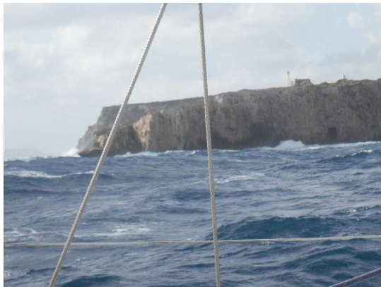
Nisos Pylos, Einfahrt Navarino

mittags baute sich allerdings eine erstaunliche See auf, Wellen von 3 – 4 m Höhe rollten auf ELENDIL zu, einige schwappten ins Cockpit, Schiff und Crew hielten sich gut und rasten gemeinsam durch Berg und Tal. Die Situation hielt sich zwischen spannend und leichter Ungemütlichkeit.