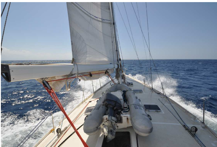
ELENLIL, Katakoló - Navarino, 10 kn Fahrt