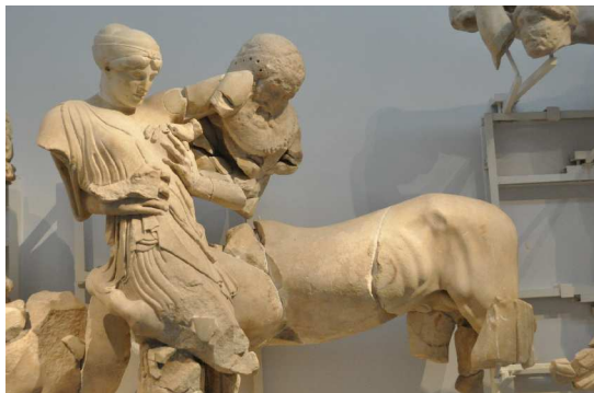
Kampf der Laphiten gegen die Centauren

Erst mit der Christianisierung in byzantinischer Zeit verblasste die Bedeutung von Olypmpia, das nach einem schweren Erdbeben etwas 500 a.D., wo die Segmente der mächtigen dorischen Säulen des Zeustempels wie Käseschachteln voneinander fielen, als weitere antike Ruine für lange Zeit vergessen wird.