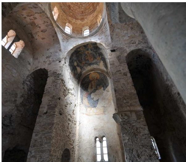
Mystras, Agia Sophia