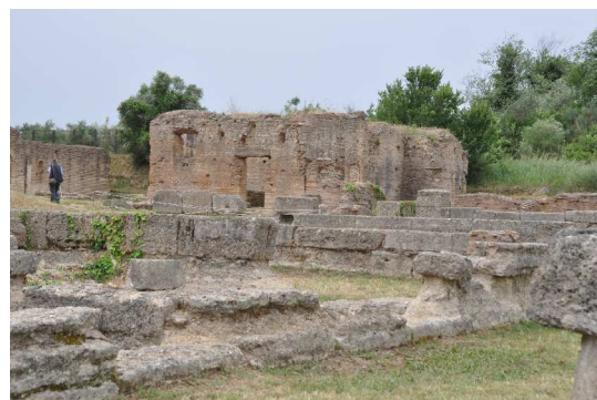
Olympia, Werkstatt des Phidias, Thermes

Die grosse Bedeutung der Olympiade wurde auch von den späteren Eroberern beibehalten, so liess sich Philipp von Mazedonien, der Vater von Alexander, durch ein rundes Bauwerk, das Philippéon verewigen, wie auch viel später Nero, der römische Kaiser sich eine prachtvolle Villa für seine Besuche errichten liess. Sehr schön ist ersichtlich, wie der modernere römische Baustil mit Mörtel, gebranntem Ton und Rundbögen sich an die klassische Block-