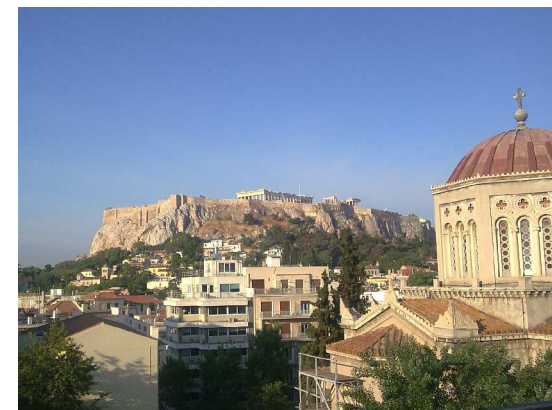
Athen, Blick von der Dachterrasse

Dank freundlicher Auskunft der Busfahrer konnte am frühen Nachmittag wieder per Bus und Umsteigen in einem kleinen Dorf die Reise nach Athen unternommen werden, der letzten Etappe. Griechisch sei Dank, der KTEL Bus hält nicht nur am abgelegenen Busbahnhof in Athen, sondern vorher an der Metrostation Eleonas, 3 Stationen bis Syntagma. Unterkunft im Metropolis, einem typischen kleinen Hotel mit Dachterrasse in der Plaka.