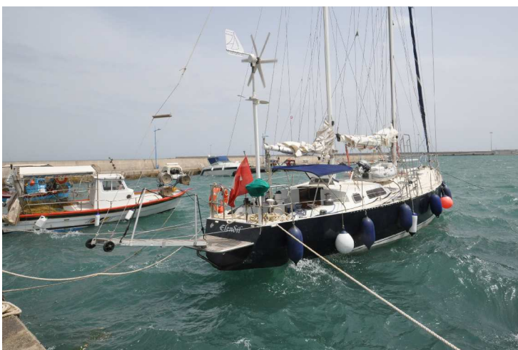
Katakoló, Wind und Schwell im Hafen

Mit Yankee, doppelt gerefftem Gross und Besan lief ELENLIL prächtig, 8 – 10 kn Fahrt mit Wind von der Seite. Es reichte für eine Suppe am Mittag. Im Laufe des Nach-