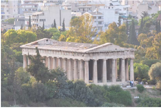
Athen, Agorá, Tempel des Hephaistos

Der obligate Spaziergang durch die Plaka mit Aufstieg zur Akropolis und einem Blick in die Agora wurde mit einem gewohnt ausgezeichneten Fischessen bei ΨΑΡΡΆ (PSARA) abgeschlossen.