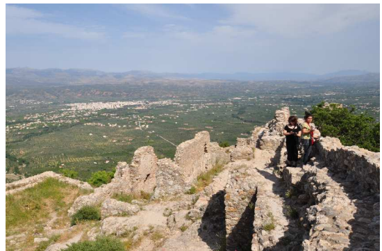
Mystras, Akropolis der Kreuzritter

Der noch gut erhaltene Palast venezianischen Ursprungs und einige byzantinische Kirchen zeugen von dem Reichtum des Ortes. Mit zunehmender Besiedlung der Ebene in Sparte verlor er allerdings an Bedeutung und fiel nach einem Erdbeben mehr und mehr der Vergessenheit anheim.