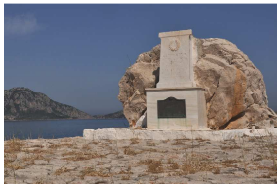
Nisos Chelonaki, englisches Denkmal

Zunächst wurde allerdings Nisos Chelonaki mit dem Denkmal der englischen Seeleute passiert, beim ersten Besuch der Bucht bereits mit dem Dinghi besichtigt und anschliessend die bizarren Felsformationen der Nisos Spakthiria bestaunt. Unter Yankee und Besan stellte man sich dann wieder Wind und Wellen des mittlerweile bekannten Tiefs. Zweckmässigerweise musste das Yankeefall gerade in den höchsten Wellen brechen um das Vorsegel langsam ins bewegte Wasser gleiten zu lassen. Eine sehr kraftraubende und unbequeme Bergungsaktion auf dem tanzenden Vordeck folgte, wobei natürlich auch noch ein Stück des Vorlieks riss.