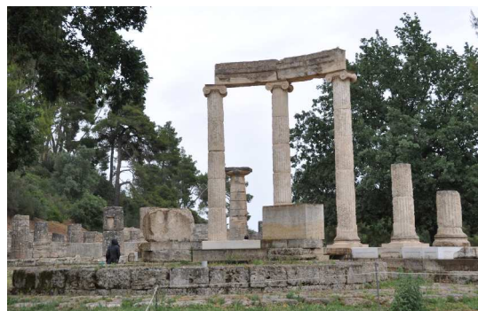
Olympia, Heratempel und Philippéon

Tags darauf gelangte man nach einer netten Fahrt mit der Schmalspurbahn nach Olympia, Heiligtum und Ort der sportlichen Begegnung der antiken Griechen, vor allem Hera und Zeus geweiht.