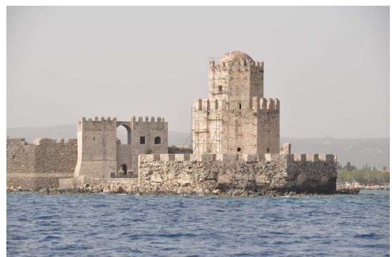
Methoni, venezianische Burg

Nach Passieren von Methoni, der venezianischen Stadt mit prominent vorgelagertem Turm, welcher durch eine kühne Steinbrücke mit der Südwestecke des Pelopones verbunden ist, schliesslich wieder unter Motor die Strecke zur Einfahrt in die Bucht von Navarino, an Pylos vorbei in den südlichen Teil der Bucht.