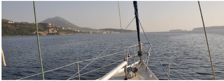
Bucht von Nararino mit Pylos und Ausfahrt, Nisos Pylos

Navarino ist für die Griechen ein wichtiger Ort, fand dort 1827 eine Seeschlacht zwischen der Flotte der türkischen Besetzer und der alliierten Streitmacht von Engländern, Franzosen und Russen statt, welche mit der Zerstörung der türkischen Flotte endete und somit zur "Befreiung" oder vorläufigen Selbstständigkeit Griechenlands führte.